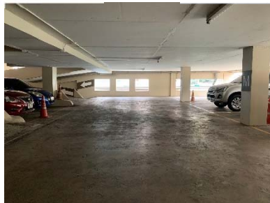
พื้นที่จอดรถยนต์