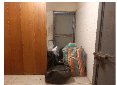
ห้องพัสดุผอยรวม