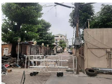
แผงกั้นจราจร