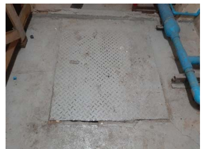
ถังเก็บน้ำชั้นใต้ดิน