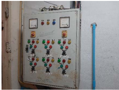
ตู้ควบคุมระบบบำบัดน้ำเสีย