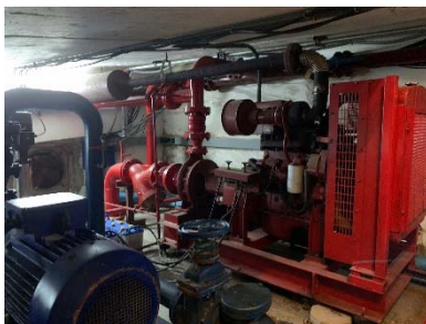
เครื่องสูบน้ำดับเพลิง