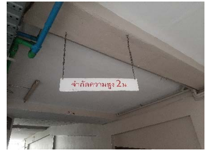
ป้ายจำกัดความสูงรถ