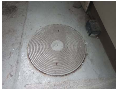
บ่อดักไขมัน