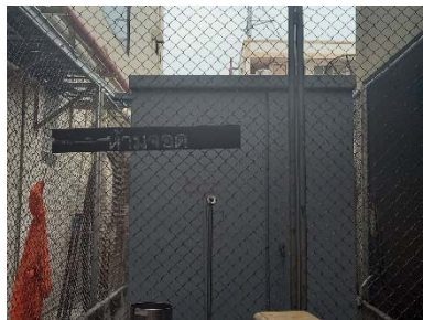
หม้อแปลงไฟฟ้า