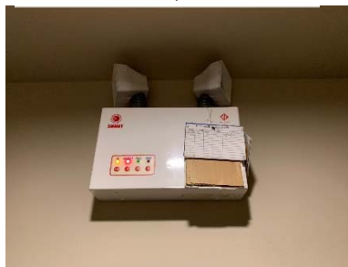
ไฟสำรองฉุกเฉิน