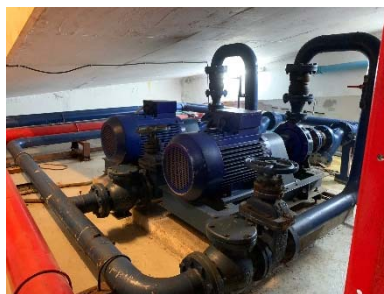
เครื่องสูบน้ำ