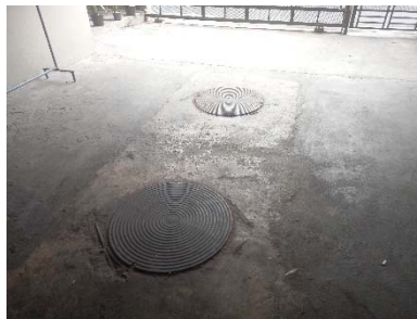
ระบบบำบัดน้ำเสีย