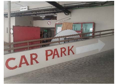
ป้ายบอกทาง