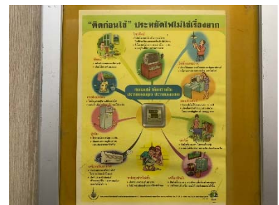
ป้ายรณรงค์ประหยัดไฟ