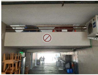
ป้ายเตือนต่างๆ