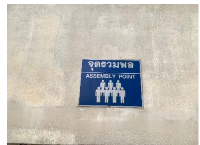
จุดรวมพล