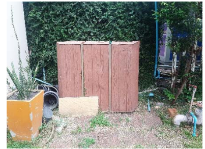
ระบบน้ำที่ผ่านการบำบัดมา ใช้ประโยชน์