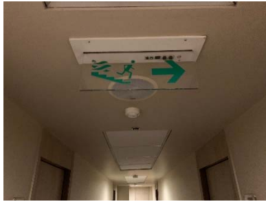
ป้ายบอกทางหนีไฟ