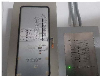
Graphic Annunciator Fire Alarm System