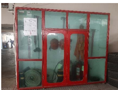
ตู้เก็บอุปกรณ์ดับเพลิง