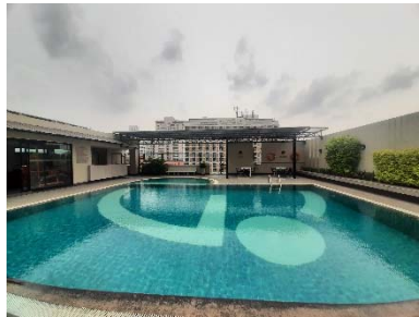
ภาพที่ 2.2-1 สภาพพื้นที่ปัจจุบัน