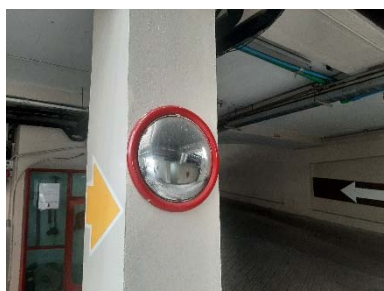
กระຈกนูน