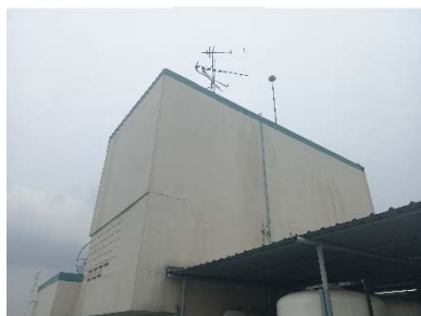
ถังเก็บน้ำชั้นดาดฟ้า