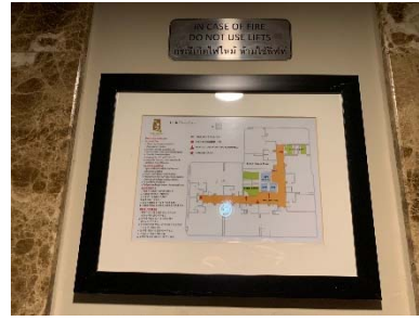
ผังแสดงเส้นทางหนีไฟ