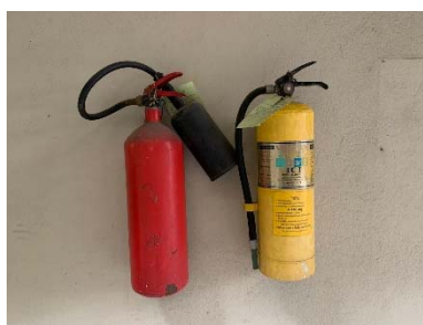
ถังดับเพลิง