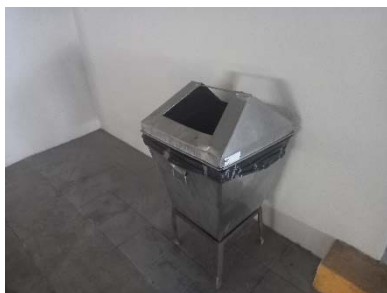
ถังขยะบริเวณพื้นที่ส่วนกลาง