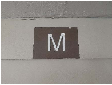
ป้ายเตือนต่างๆ