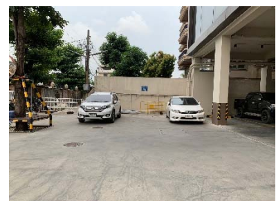
บริเวณที่จอดรถรับส่ง