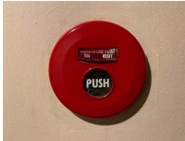
Fire Alarm Manual Station