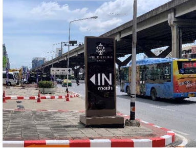
ป้ายบอกทาง