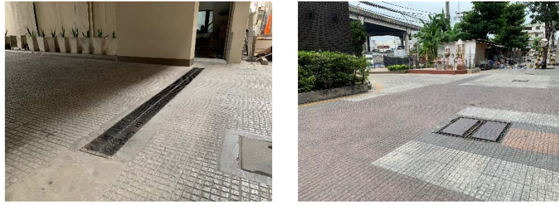
ภาพที่ 2.2-7 การระบายน้ำภายในโครงการ