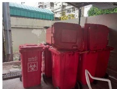
ถังขยะอันตราย