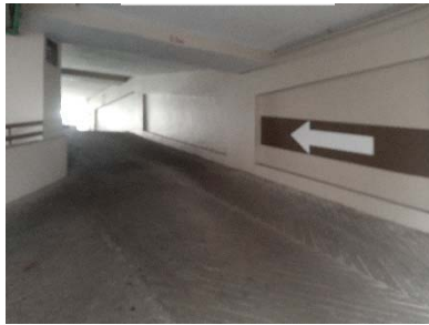
ป้ายบอกทาง