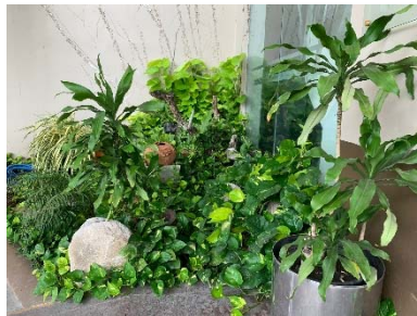
ภาพที่ 2.2-2 พื้นที่สีเขียว