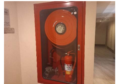
Fire Hose Cabinet