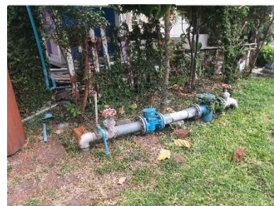
มิเตอร์น้ำ