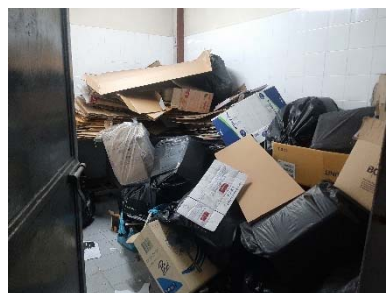
ห้องพัสดุผอยรวม